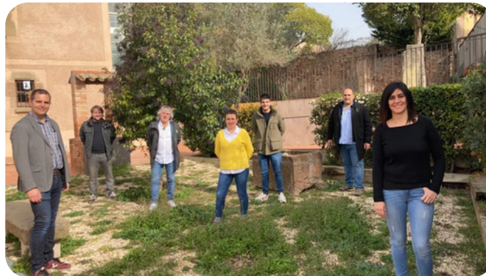
L'Equip de Govern